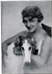
G.-L. Manonni Frères

79.83.08 BOULEVARD HAUSSMANN 11 AVENUE DE VILLIERS TELEPHONES: LOUVRE 23-01. GUTENBERG 24-29